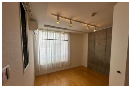
※同タイプ(反転)他貸室の写真を使用しています